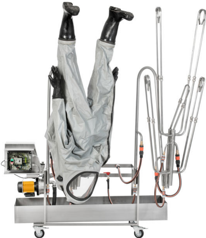
Ausführung HT-302-A *Symbolfoto

Modulare, mobile Wasch-, Desinfizier- und Trockenstation