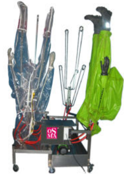
Ausführung HT-304-A *Symbolfoto