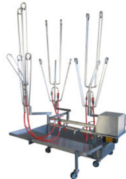
Ausführung HT-303-A *Symbolfoto

Die elektronisch gesteuerte Saug- und Druckpumpe bzw. das Warmluftgebläse reichen bis zu vier Schutzanzüge gleichzeitig. Auch die Wasch-, Desinfizier- und Trocknungshalteorgane sind aus Edelstahl gefertigt. (Waschen, Desinfizieren und Trocknen benötigt ca. 4 Stunden)